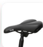
Comfort+ ♂ €44,95